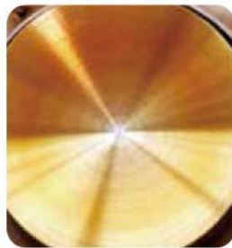
Mobil 1™ OW-40